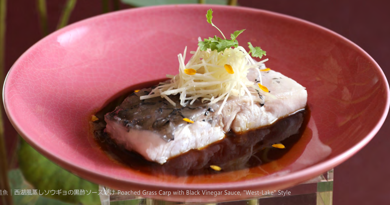
西湖醋魚 | 西湖風蒸しソウギョの黒酢ソースかけ Poached Grass Carp with Black Vinegar Sauce, "West-Lake" Style