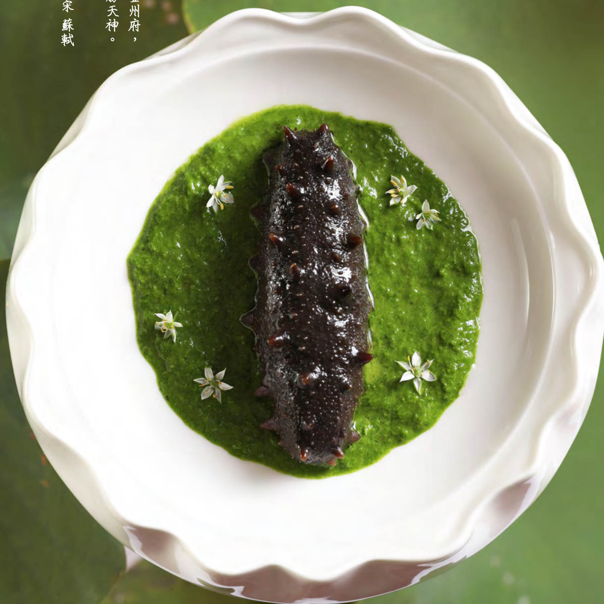
翡翠蔥刺參 | ナマコのねぎ煮込み Stewed Sea Cucumber and Scallion